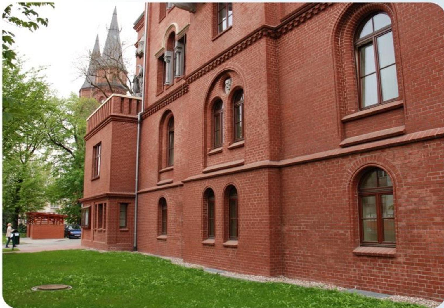
Wizyta w Centrum Aktywizacji Zawodowej ul. Gliniana 20-22, 50-525 Wrocław